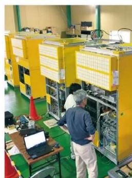
加速電源（北関東事業所）