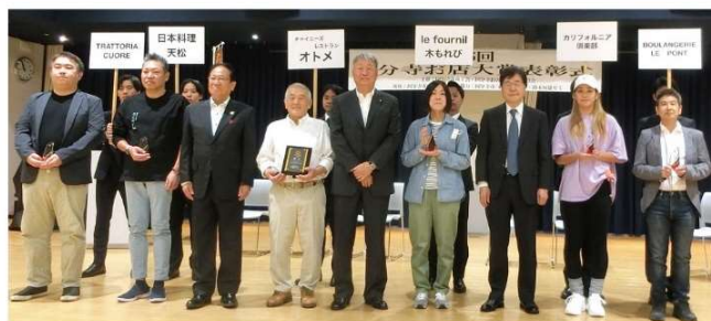
国分寺お店大賞の公式マスコットキャラクターが近日発表となります！公式SNS、公式HPにて発表いたしますので、ぜひ楽しみにお待ちください。