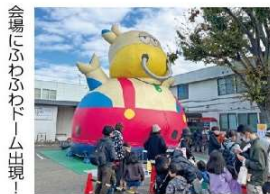
会場にふわふわトーム出現！

令和5年11月25日(土)に国分寺市役所駐車場で実施し、1,748名にご来場いただきました。