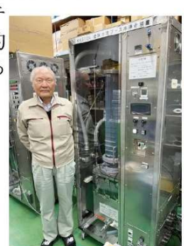
塗装ブース水浄化装置