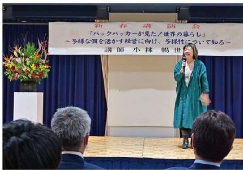
令和6年の新春講演会